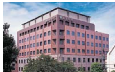
山王病院(東京都港区)