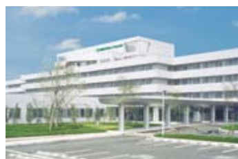
国際医療福祉大学塩谷病院