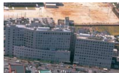
高木病院(福岡県大川市)