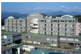
国際医療福祉大学病院