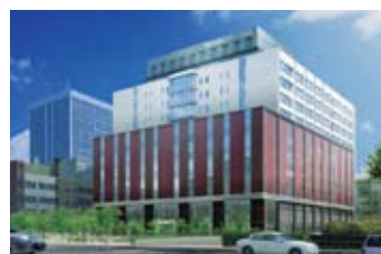
国際医療福祉大学三田病院 2012年春 新病院竣工予定