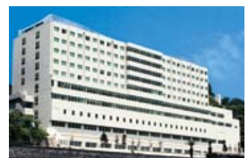
国際医療福祉大学熱海病院